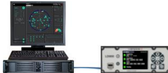
Quantum y el LD900 en la misma subred

La PC con Windows debe estar en la misma red que el LD900. Para encontrar o cambiar los parámetros de red del puerto LAN2 en el LD900, navegue hasta Receiver > Network .