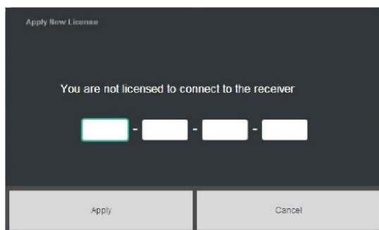
Solicitud de Licencia de Quantum

En la página New Configuration: Save Configuration , ingrese un nombre a la configuración. Es una buena práctica crear un nombre informativo para la configuración, como el nombre del barco y la fecha, o el nombre de un proyecto específico. Después de ingresar el nombre, haga clic en Save & Launch .